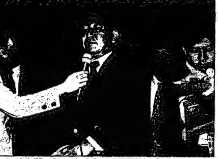
رئيس الوزراء الياباني يوشيدا يشرح الخطة الاقتصادية الجديدة

طوكيو - من يوكيوكي جيوكو وافق وزراء الحكومة اليابانية في اجتماعهم في العاصمة طوكيو على خطة للإنعاش الاقتصادي بقيمة 93 مليار دولار. وتعد هذه هي المرة الأولى التي تنخفض فيها الأرباح منذ عام 1994. وتعد هذه هي المرة الأولى التي تنخفض فيها الأرباح منذ عام 1994.